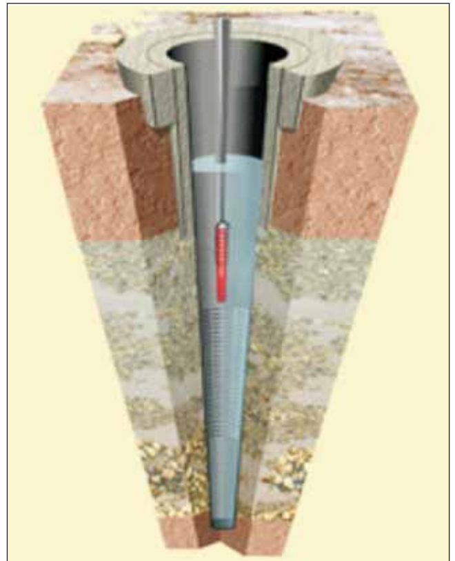
Figura 2. Un pozo perforado moderno puede realizarse en pocas semanas hasta profundidades de un millar de metros.

Como se resume en Llamas (2005c), la primera evaluación cuantitativa de los recursos de agua subterránea de España se realizó en 1966. En un artículo de 1968 se expusieron los resultados del Estudio de Recursos Hídricos Totales realizados en los Ríos Besos y Bajo Llobregat y se propuso la realización de estudios análogos en toda España. Esto es lo que luego vino a exigir la Ley de Aguas de 1985. En ese artículo