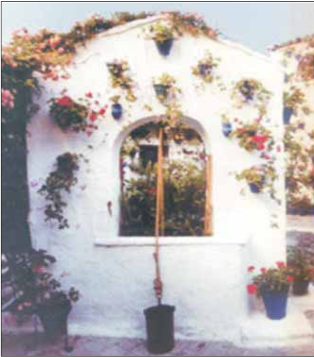
Figura 1. Ejemplo de pozo excarvado tradicional.

Sin embargo, en el último medio siglo la situación ha cambiado notablemente debido principalmente a los avances tecnológicos en la perforación de pozos y en los sistemas de bombeo. Estos dos factores han conducido a un notable abaratamiento en los costes de extracción de aguas subterráneas, lo que ha inducido el aumento espectacular en su uso en prácticamente todos los países áridos o semiáridos (Llamas y Custodio, 2003). Quizá el caso más notable sea la India donde se han puesto en regadío con aguas subterráneas más de 40 millones de hectáreas en los últimos cuarenta años. Y ese país ha pasado de padecer hambrunas frecuentes y generalizadas a convertirse en un importante exportador de grano (Shah, 2005). Este desarrollo del agua subterránea ha sido usualmente financiado y realizado por particulares o pequeños municipios.