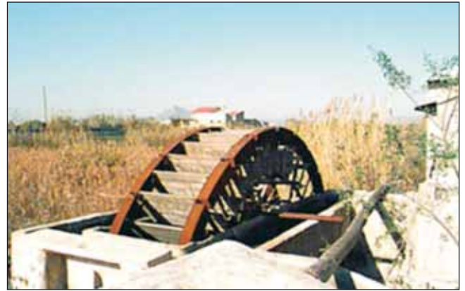
Figura 3. Las antiguas norias han desaparecido.

Por otra parte, lo ocurrido en la Cuenca del Segura después de 1968, también ha sucedido y sucede en otros muchos sitios de España y del mundo. Se ha producido un enorme vacío entre las administraciones hidráulicas y los usuarios de aguas subterráneas, en su mayor parte, modestos agricultores. Ese vacío sigue casi igual veinte años después de haberse promulgado la Ley de Aguas de 1985 que teóricamente atribuye grandes competencias de control y planificación de las aguas subterráneas a las Confederaciones Hidrográficas.