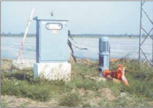
Figura 4. Regadío de fresas “en tunel” con aguas subterráneas en Doñana.