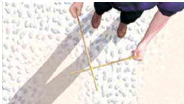
Figura 5. Todavía en muchas zonas la búsqueda de aguas subterráneas es realizada por “zahorías”.

El comercio de agua virtual puede permitir a los países de escasos recursos hídricos evitar lo que hasta hace muy poco se consideraba una probable e inminente crisis. Casi la única condición requerida es que esos países tengan un nivel económico que les permita comprar en los mercados internacionales los alimentos portadores de agua virtual. Como se verá después, esos